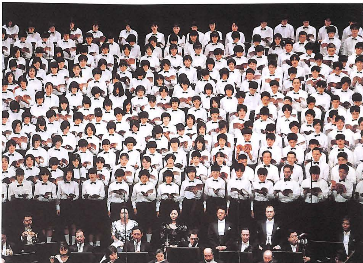
ブラボー膳所高！！ 関わっていただいた大勢の皆さん、本当にご苦労様でした。感激！感謝！