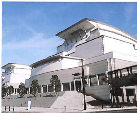
秋晴れの会場、びわ湖ホール。