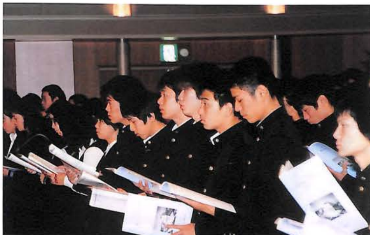
全校生徒1,312人の一生の思い出