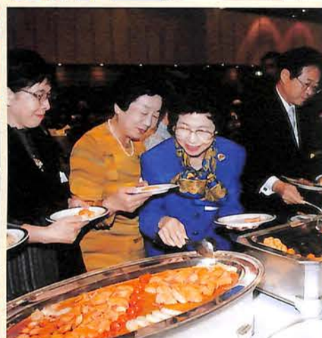
先輩・後輩700名、和気あいの大祝宴