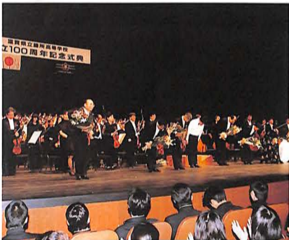
万雷の拍手の中、フィナーレ。