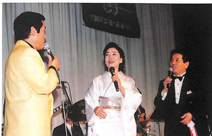
「君は心の妻だから」