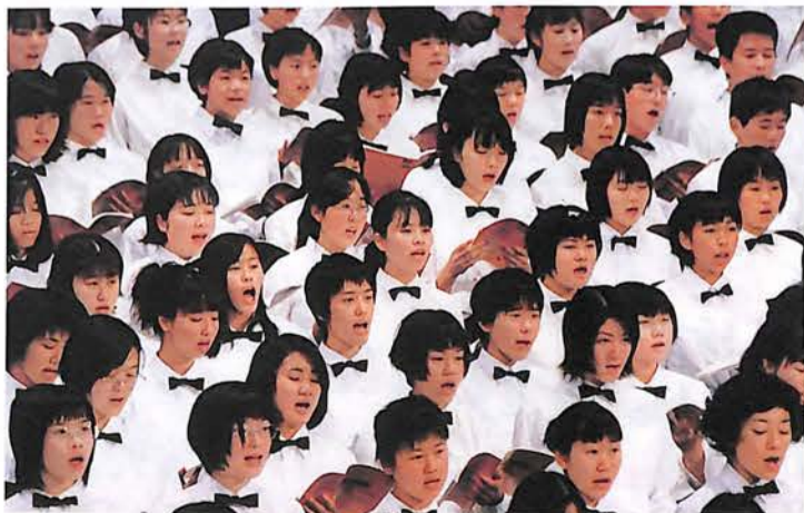
1年間の練習成果を感激のうちに披露