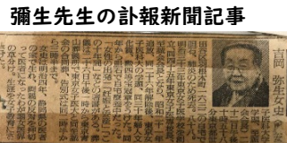
とても貴重なもの