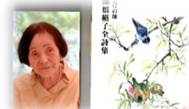
晩年、本会総会にお孫さんとご参加をさせていただきました

昭和16年(1941年): 日本が太平洋戦争に参戦。12/8日本海軍はハワイの真珠湾を奇襲攻撃 昭和18年(1943年): 6/25「学徒戦時動員体制確立要綱」を決定、7/5にB-25が日本本土へ初空襲 昭和20年(1945年): 日本が第二次世界大戦に敗北し、ポツダム宣言を受諾