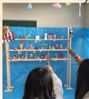
[1-4] 集まって欲しいけどソーシャルディスタンス忘れずに