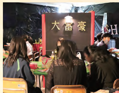
[3-3] トランプゲーム等