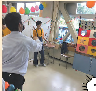
[1-5] キッキングスナイパーゲーム