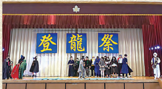
1位 [3-1] 担任が魔王だった件について