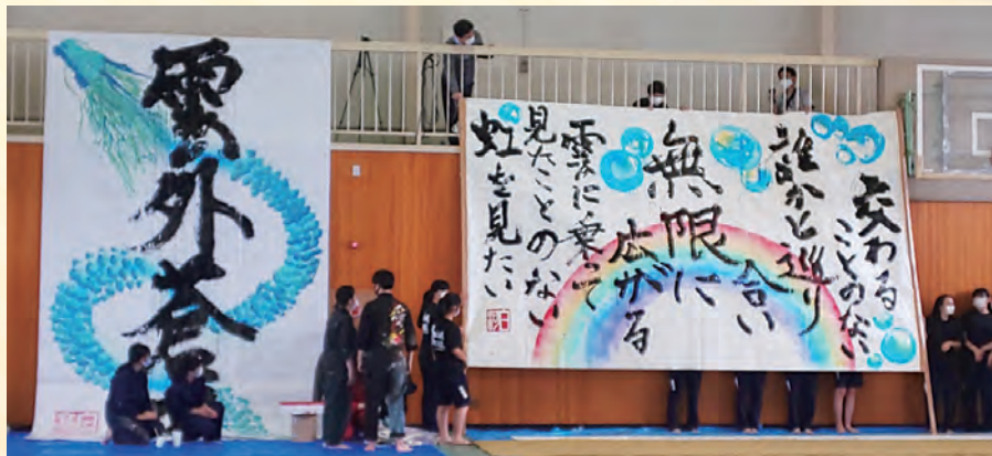
書道部と美術部のコラボによるパフォーマンス