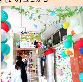
[2-4] ドキュメンタリーを自分達で撮ります