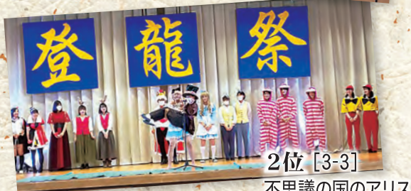
2位 [3-3] 不思議の国のアリス