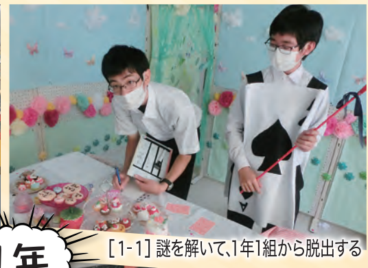
[1-1] 謎を解いて、1年1組から脱出する