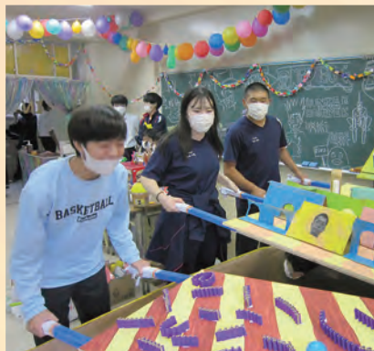
[2-5] VS嵐のように色々な物で競争する