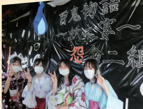
[3-2] 謎解きをして脱出する