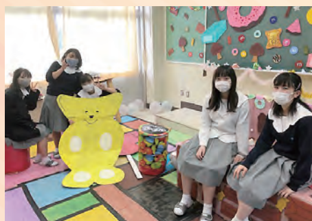
[1-6] 色々な世界観のフォトスポット