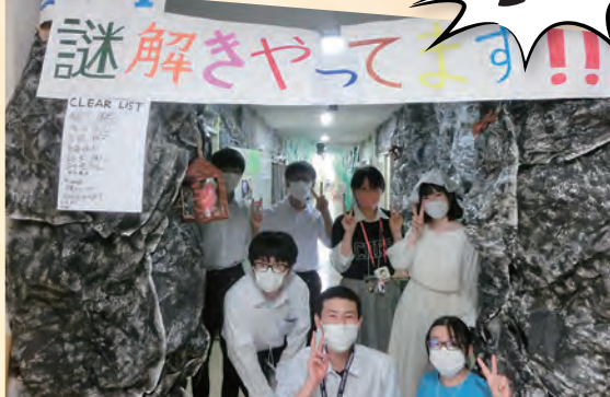
[2-1] 新感覚の協力型謎解き