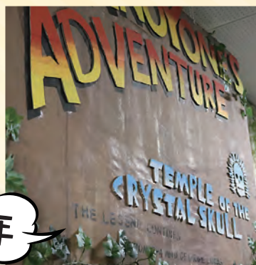
[3-4] 時間内になぞを解いて迷路をクリアしろ