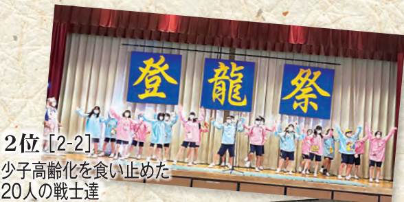
2位 [2-2] 少年高齢化を食い止めた20人の戦士達