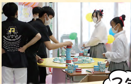
[3-5] かかってこい喧嘩上等!!