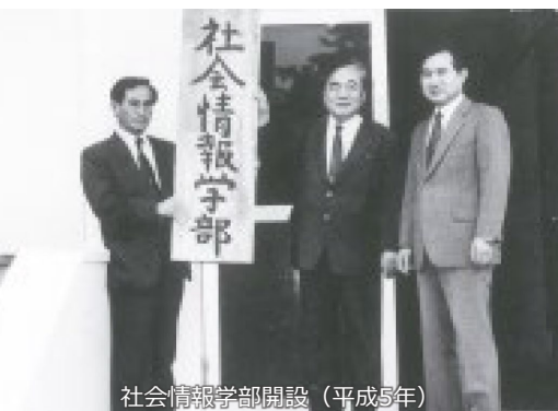
社会情報学部開設（平成5年）