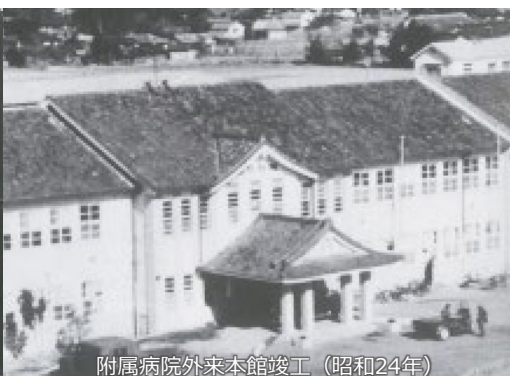
附属病院外来本館竣工（昭和24年）