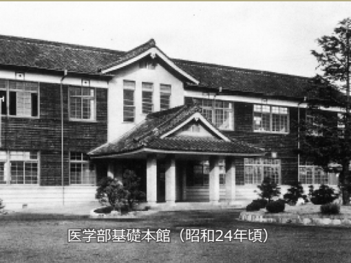
医学部基礎本館（昭和24年頃）