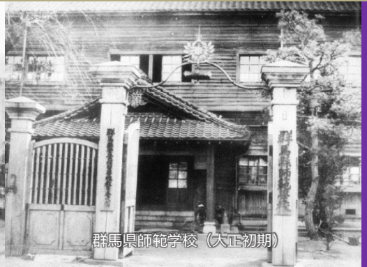
群馬県師範学校（大正初期）

群馬大学は、令和5年度に本学の起源である「小学校教員伝習所」設立から150年を迎えます。