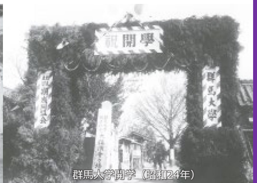
群馬大学開学（昭和24年）