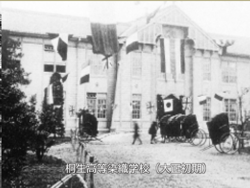
桐生高等染織学校（大正初期）