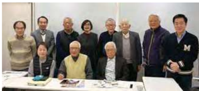
鳳志会プレス 編集委員(3月14日)

● 鳳志会プレスも23号になりました。「こんにちは先輩」では多くのご活躍された卒業生の方々を紹介してまいりました。吹田高校も捨てたものではないと、胸を張って言えると思います。現在クラブで模型工作部が元気に活動しています。好きな事に夢中になれる場をもっと作って欲しいと思います。私たち編集委員はいつも応援しています。(18期生 T/M)