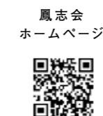
鳳志会 ホームページ

会員の皆さまにおかれましては、ますますご清祥のこととお慶び申し上げます。平素より鳳志会の活動に対し、多大なるご理解と温かいご支援を賜り、厚く御礼申し上げます。 私が会長に就任いたしましたから、早いもので5年目の節目を迎えました。副会長をはじめ、理事、学校関係者様そして会員の皆さまのお力添えにより今日まで歩みを進められましたことに、心より感謝申し上げます。