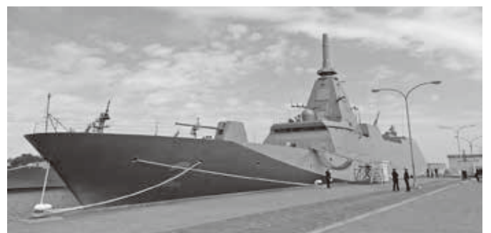
2022年3月、横須賀に配備された海上自衛隊最新鋭の護衛艦「くまの」