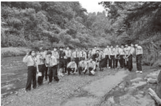
チバニアンに全員集合

今回のツアーの目的地は「チバニアン」と、かずさDNA研究所。チバニアンは養老川流域の地磁気逆転地層のことで、現地では、ガイドから詳細な説明を受けました。また、かずさDNA研究所では、「謎のお肉」のDNA鑑定実験を行い、参加者は興味津々に鑑定を行いました。