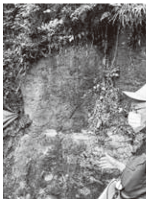
現地ガイドからの説明