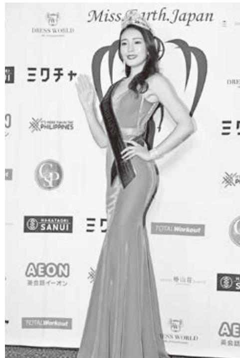
グランプリのティアラを着けて

ミス・ユニバース、ミス・インターナショナル、ミス・ワールドなどと並び、世界4大ミスコンの一つと言われている「ミス・アース」。コンテストを通して、環境保護への意識向上を訴えることを目的として2001年より開催されています。