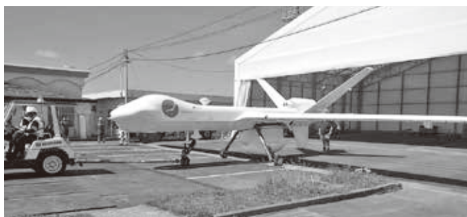
2018年5月、長崎壱岐空港で実証試験中の「シーガーディアン」 (注:2022年10月から海上保安庁が洋上監視のための運用を開始)

法規が定めているものです。もし、我が国に対し他国が侵攻して防衛出動が下令されても、相手国が自衛隊を軍隊と認識しなければ、ジュネーブ条約の適用を受けない危険があります。憲法を改正して警察組織の延長ではなく、国防組織であることを内外に明確に意思表示することで、真の抑止力となり、外交の後ろ盾とすることが大事です。 国際社会においては、力の強い国のルールが幅を利かすのであって、条約等が結ばれているからといって安心できない