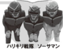
ハリキリ戦隊 ソーサマン