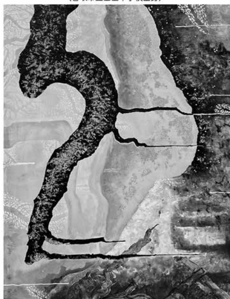
出展作品「リベアパッチ」油彩 F50