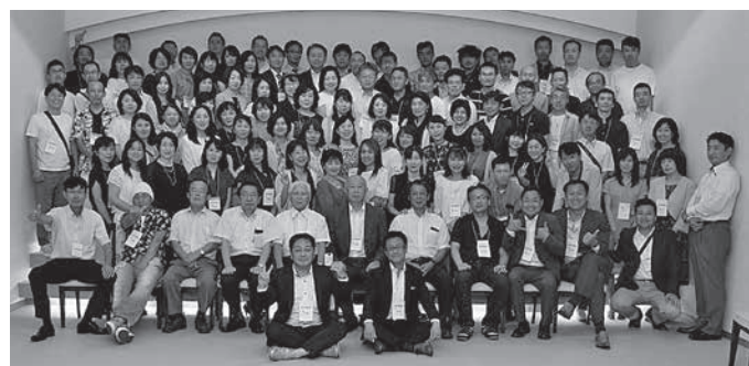
高40回同期会 8月17日 三井ガーデンホテル(千葉市)