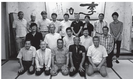
嘉儀屋で行われた干潟支部総会

今年度は同窓会総務部長、同 窓会事務局長にも参加いただ き、総勢21名で総会を行いました。 総会では役員の改選などの 議事を行ったほか、現在の高校 の進学状況や部活動の活躍など の説明をいただきました。参加 者は後輩たちの活躍を誇りに思