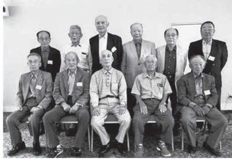
第14回匝高無線部OB会

匝高無線部は当時70名を超える部員を擁したが、名前だけの部員もあり、OB会は現会員による推薦で仲間入りして貰っている。元無線部員で希望があれば連絡頂きたい。減るばかりのOB会なので歓迎したい。話が逸れた。―閑話休題―