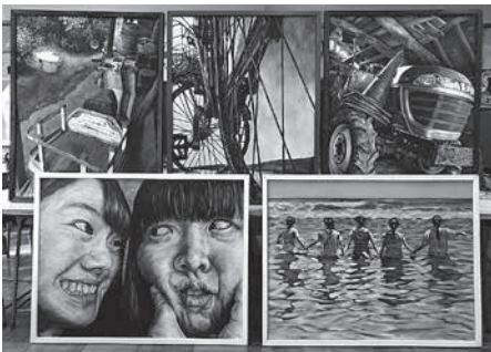
美術部 国際美術展作品