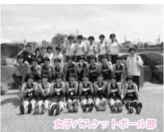
女子バスケットボール部