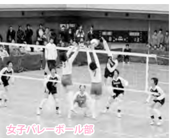
女子バレーボール部