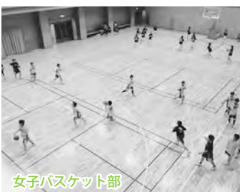
女子バスケット部