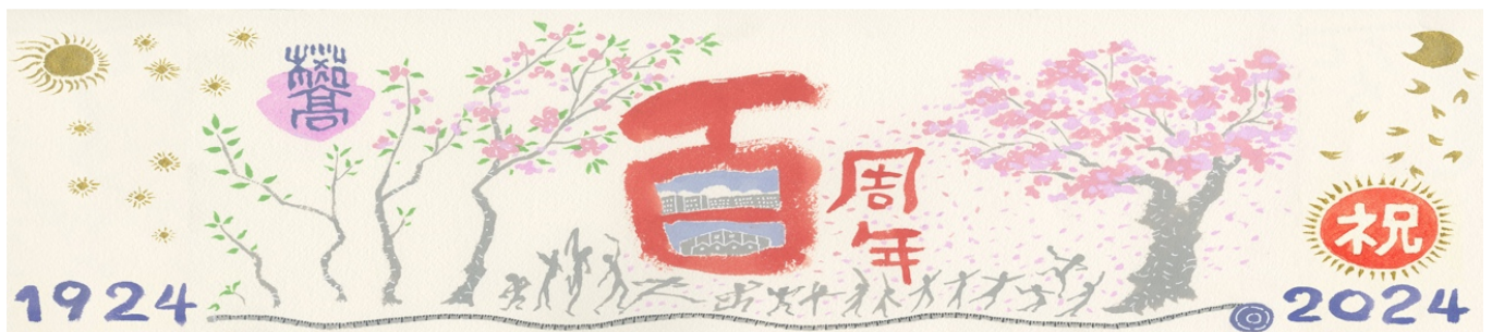
画 山村 浩二(桜台高同窓生)

【寄付内容(予定)】 1. 緞帳贈呈を目標とし、校内の古くなった施設設備の新調・補修費用や、記念行事等課外活動費の補助として使用。集まった金額や、学校状況に応じて内容を決定。 2. 在校生への定期的継続的な支援として使用。例えば、ファッション文化科が毎年行うファッションショーの会場や設営、材料などの費用支援・課外活動への消耗品(ボール、ユニフォーム等)などへの定期的支援・全国大会、上位大会出場の臨時支援等。 3. 桜丘会が母校支援を継続的に行うための、より利用しやすいウェブページの運営・同窓生、在校生への定期的情報発信の支援等の費用として使用。