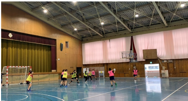
桜朋館の遮光カーテン