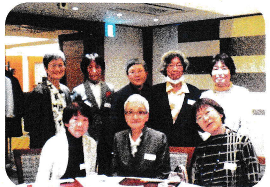
大学3・5・6・7・8・9回のみなさん