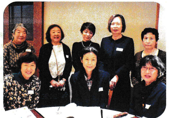
大学11・12回のみなさん