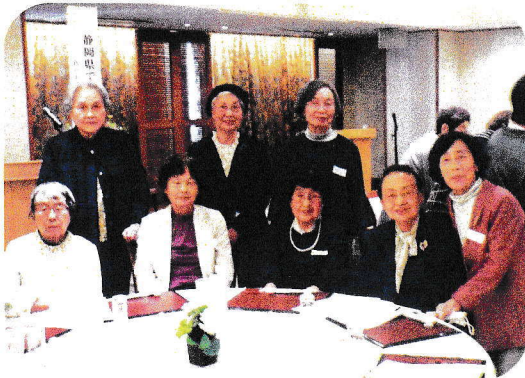
短大3・8・13回のみなさん