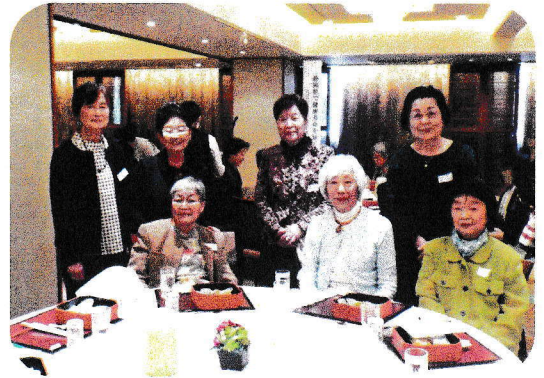
短大10回のみなさん