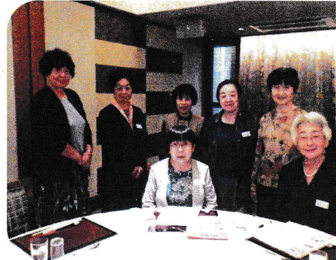
短大14・15回 大学1・2・4回のみなさん