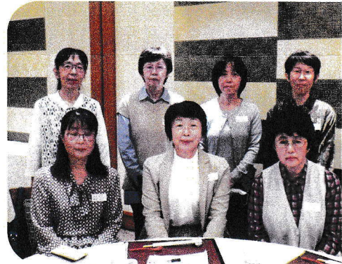
大学10・13・15・16・19回のみなさん