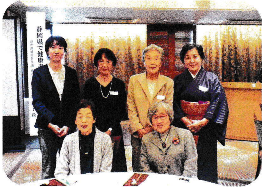
来賓・講師・役員のみなさん