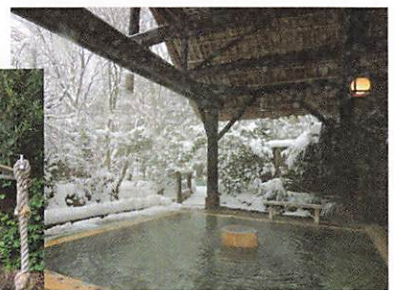
那須 幸乃湯温泉 玄関と露天風呂