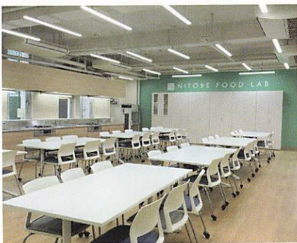
NITOBÉ FOOD LAB