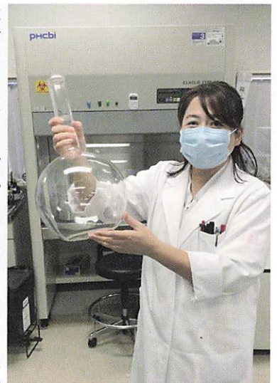
けいゆう病院の細菌検査室で 検査室内の整理をしていたら、大きなフラスコが見つかりました。新型コロナウイルスの大流行で検体保存用培地の調製で、出番が期待されたのですが、既製品が補充され、箱入りのままとりました。

改革と若手育成を依頼され、令和元年四月より神奈川県警友会けいゆう病院に移りました。現在は細菌検査の傍、感染制御センターの業務を行なっています。臨床検査技師を取り巻く環境