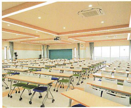
NITOBÉ HAPPINESS HALL