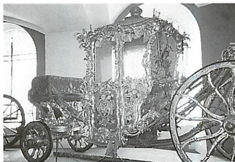
クレムリン宝物殿内の馬車

ミールの黄金の門で軍事史展示、ウスペンスキー大聖堂で古代ロシア画家の壁面を觀賞、19時頃ホテル着、夕食は市内レストランで民族舞踊ショーを楽しみながらとりました。 26日、ユネスコ世界文化遺産のスズダリ観光。13世紀頃の建物や移築された木造の教会、水車小屋、一戸建の農家、果樹園野菜畑、家畜もいて中世田園都市として維持保存され、物静かでホッとする佇まいです。 クレムリンで17世紀のイコンや円型屋根の教会の珍しい大提灯があり、スパソ、エフアイミエフボクろフスキー修道院で銀の飾りカバーを持つロシア最大の福音書、印刷術の展示、近くのカメカ河の岸からは男尊女卑の犠牲者の流刑先ボクロフスキー女子修道院が見えました。