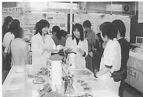
昨年度学園祭風景