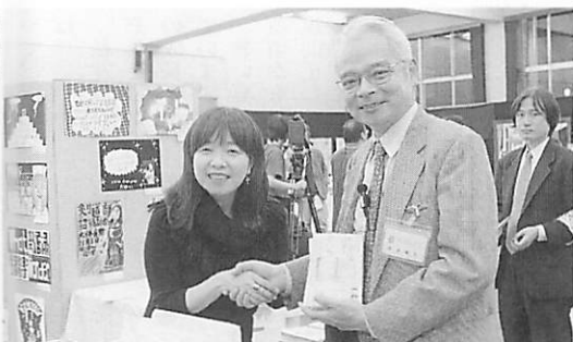
森本理事長と握手するイルカさん

終了後、イルカさんの書き下ろしエッセイ「ここは私の学校」の発売記念サイン会が開かれました。