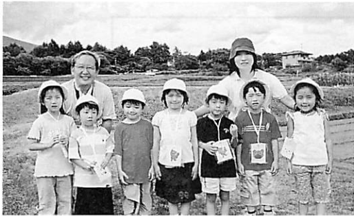
浅間宿泊保育(年長組) オリエンテーリング