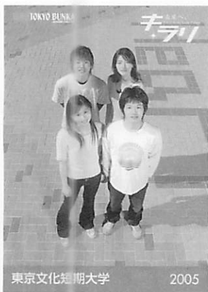
東京文化短期大学 2005

三専攻三資格の短大 一 栄養士・介護福祉士・保育士 《生活学科》 二〇〇二年に家政科から「生活学科」に学科名を変更しました。学科名は、さらに具体的な教育の提案や教育内容を示すものとなりました。「生活を考え、生活力を養う」、それは創立精神や創立者の意向にも添うものと確信しています。そして三年間の大改革の中で男女共学を導入し、生活福祉専攻と児童生活専攻を設置しました。また、ホームヘルパー二級の資格が取得できる訪問介護員養成研修事業も始めました。以下は、昨年からの各専攻の動向です。