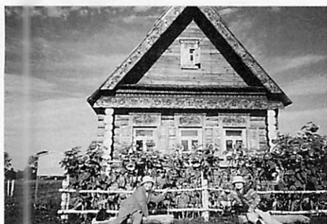
中世の町スズダリ(世界遺産)