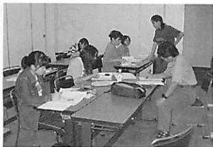
合宿講習“希望者は深夜まで勉強に精を出す！”

このような状況の中で、二名が進学した上智大学から講師を招いての進学ガイダンスを開催するなど、進路指導もさらに上の難関大学をめざす形をとっています。そのため通常の土曜講習をはじめ夏期講習・冬期講習・合宿講習によって大学入試対応の学習を進めています。特に高校一・二年生