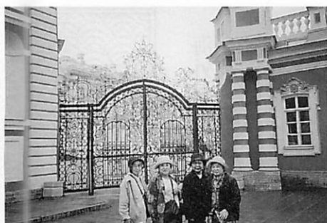
エカテリーナ宮殿の門前で

29日、郊外プーシキン市のエカテリーナ宮殿へ。金色に輝く壁、寄木細工の床、枠飾つきベチカ、琥珀の間の美しさにたんのうし、空路モスクワ経由、30日10時半頃無事帰国しました。