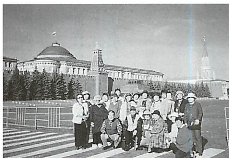
赤の広場を入れて記念撮影

術館へ。12、17世紀の古代芸術、19、20世紀の絵画、彫刻、線画、20世紀絵画の3部門。美術歴史研究蒐集家商人の長年に及ぶコレクションを見ました。 25日クレムリンへ。ウスペンスキー大聖堂のイコン、フレスコ画、壁画、鑄造の金属装飾品の美しさに見とれ、次の宝物殿武器庫の古代岩石、鎖帷子、モノマヒの帽子、寶石飾りの女帝の王冠、象牙板の玉座、馬車、装飾刺繍の衣服、金属手工芸細工のコレクシオンに王族の財力の豊かさを感じ、午後バスで200kmのスズダリへ。昼食は車中で、赤い実のななかまどが混って並木道は楽しく、途中古都ウラジ