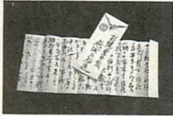
新しく見つかった第一高等学校校長時代の新渡戸稲造の書簡