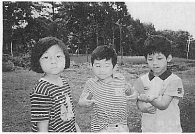
「何の虫か知ってる？」 「オー・ノー」

責任の自覚は、義務を理解し、集団における自己の存在の確立、自立への大きなステップとなりまふ。又、そのことは、集団と自分とのかわり方、集団における自分とまわりの友達とのかわり方、あり方を学ぶことにもつながってきます。この意味からすると②と③は一つの事を別の二つの面からみたととも言えます。 ③ 友達と 仲良く助け合おう。 人間は社会人としての要素が極めて強く、一人でのみ存在する人間は、社会人にはなりにくいものです。やはり二人以上の人間が一緒に生きる事によって人間は社会人としての良い面を出せるようになります。生きる主体性を大きく土台として、そこに自分以外の人間、つまりまわりの人間との相対性を加えて、更によく考え、お互いにはげまし合ったりしながらよ