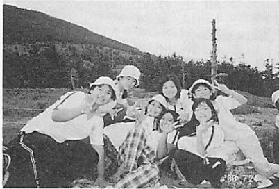
横岳坪庭ハイキングでイェーイ

責任の自覚は、義務を理解し、集団における自己の存在の確立、自立への大きなステップとなりまふ。又、そのことは、集団と自分とのかわり方、集団における自分とまわりの友達とのかわり方、あり方を学ぶことにもつながってきます。この意味からすると②と③は一つの事を別の二つの面からみたととも言えます。 ③ 友達と 仲良く助け合おう。 人間は社会人としての要素が極めて強く、一人でのみ存在する人間は、社会人にはなりにくいものです。やはり二人以上の人間が一緒に生きる事によって人間は社会人としての良い面を出せるようになります。生きる主体性を大きく土台として、そこに自分以外の人間、つまりまわりの人間との相対性を加えて、更によく考え、お互いにはげまし合ったりしながらよ