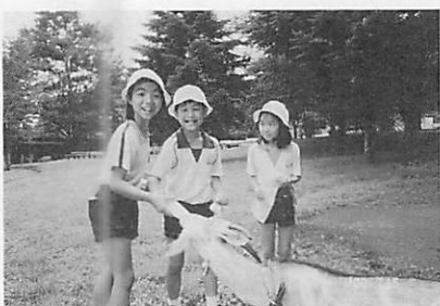
ぼくが私が育てたヤギひげさん

て言えば、東京文化の特色の一つである学年の枠を越えた縦割りのグループでの生活がここでも行われます。これは学期中も、毎日のお掃除や歩く会など常時実施されている事の一学期総まとめの一つとして位置づけられるものです。これは一学年一学級の大きな夢を育てる小さな学校であるからこそできる素晴らしい人と人との触れ合いです。いつもは同じ学年での共同生活が多い中で、学年の違う友達とお互いに知り合い、励まし合っていくことができます。