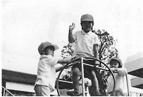
ジャングルジムで

初めての夏休みに沢山の経験をしてひと回り成長し逞しさも増した年少組の子ども達は「先生、ぼく新幹線に乗っておじいちゃんのおうちに行ったの。」「わたしね、プールで顔がつけられるようになって来ました。」