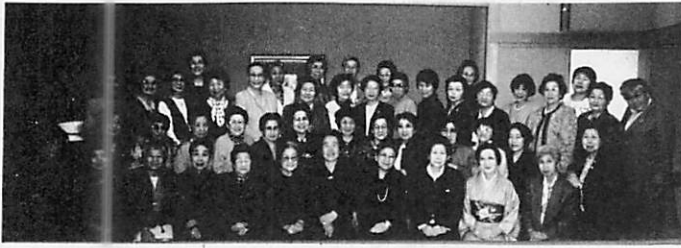
高女の49人が集まってパノラマ写真を撮りました。

今年は例年になくお寒い日が続き、当日のお天気がただただ心配でございました。当日になりましたら四月の暖かい日ぞ