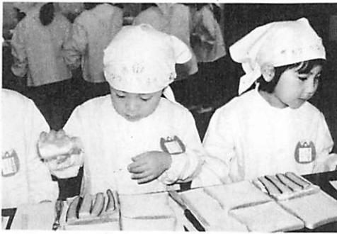
真剣な顔でサンドイッチ作り

でした。スモックを着て、三角巾をつけた子供達はとてもはりきって、短大調理室へ出かけます。