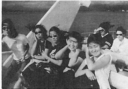
グレートバリアリーフクルーズ

ケアンズでのフライングドクター施設見学では、大国ならではのセスナ機による医療活動を知ることができた。国内には医療施設のない地域もかなり存在するため、定期検診などもセスナ機で飛ぶ医師によって行われている。 実際に機内を見学すると、あらゆる領域の治療や検査に必要な医療機器が携帯化されるなど工夫されて所狭しと装備されていたのは目を見張るものがあった。また、常に緊急の対応に追われるスタッフの献身的な姿をビデオで見ることができ、医療の奉仕の活動が直