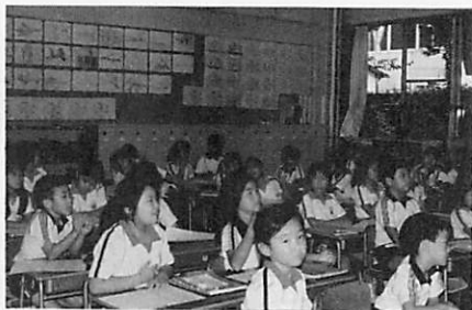
I'm not sleepy.

けた英語教育と比べたら、格段のちがいです。私の努力不足を棚上げして敢えて言えば、もし、自分がこのような教育環境にいたならば、今とは違った、もう少しはましな英語の使い手になれていたかもしれないと思います。