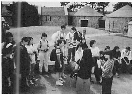
ヨーロッパ研修 クロンマクノイズにて