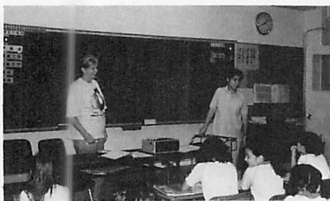
It's time to get up.

「ユー・ハフトゥー・ゴトゥー・ベッド」という具合に。これは、英語を母国語とする家庭で、幼児が同じように言った何となくそれらしい表現を、母親が正しく幼児に投げ返してやりながら教えていく場面とそっくりだと思えました。もしもこれが毎日朝から晩まで繰り返されるなら、子どもたちの「生きた英語」は、またたく間に上達するでしょう。残念ながら毎週一回の40分だけです。でも、過去に私が地方の中学で受