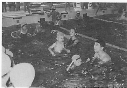
初心者への輪くぐり

けた面白いゲームをいろいろ工夫して、班対抗の得点競技を行い、水泳を楽しむということを主眼にして実施しています。