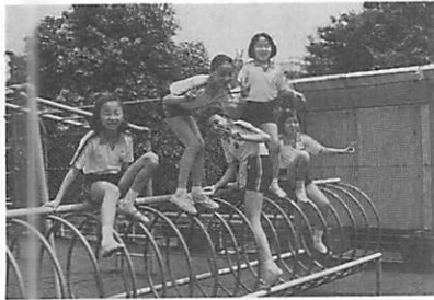
休み時間に屋上で

本校では、創立以来、少人数制や副担任制などを通して個性尊重の教育をして来ましたが、今後も指導法の研究や教育内容の改善を通して、さらに子どもたちそれぞれの天性を見出し、それを伸ばして行けるような教育を旨として努力をしたいと思っています。