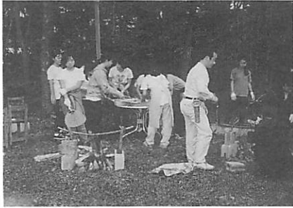
浅間教室での野外活動

今年のこの欄でお知らせしましたように、短大設置基準が改正され、各短大が特色あるカリキュラムを自主的に編成できるようになりました。