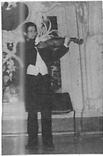
ボンの宮殿で演奏 4年6月

スンの在り方の違いを如実に表しているように思われるのです。つまり一般的には授業中やレッスンの最中には、日本では生徒はできるだけ静かにしていて、ただ先生のいうとおりおとなしく従うように要求されているのではないかと思われます。