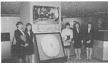
日銀貨幣博物館の見学 大きい石貨の前で