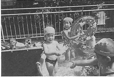
プール遊び (こぐまぐみ)

新しい園生活への期待よりも、母親と離れる不安でいっぱいの子組を迎えたいこぐま組。