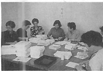
「泉」の山と取り組んで

運営面でまだ充分とは申せませんが、お芝居を楽しんでいたことが母校を支える力に通じると