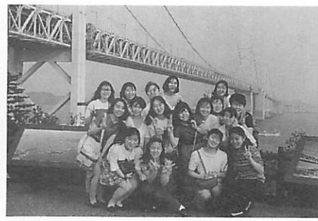
2年生 岡山研修旅行