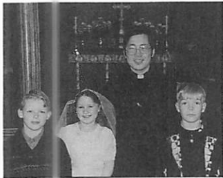
初聖餐の子どもたちと 3年6月

二十一年前、私が十七歳で英国に渡った頃は、英国の学校制度の下で教育を続ける心づもりは全くありませんでした。幸い個人教授