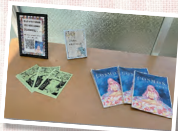
漫画イラスト研究部

第11回全日本高等学校チアリーディング大会予選 小編成部門1位通過 高校ストリートダンス選抜大会 第14回日本高校ダンス部大会 近畿・中国・四国大会 ビッグ部門4位通過 第14回日本高校ダンス部大会 小編成部門 2位 第11回全日本高等学校チアリーディング大会予選 小編成部門4位 大編成部門2位 高校生ダンスコンテスト 門第2位 第3位 ビッグ部門 マイナビ HIGH SCHOOL WEST vol.1 スモール部門