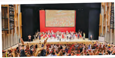
吹奏楽部 「0100ダンス」本番より

選手権ダンススタジアム全 準優勝 ビッグ部門 第14位 チームダンス選手権全国大会 編成部門8位 MVD in 高槻 スモール部 門第2位 第3位 DANCE COMPETITION 2022 1位通過 ラージ部門2位