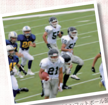
アメリカンフットボール部