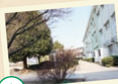
昭和42(1967)年 十字棟を臨む