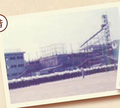
昭和40(1965)年 体育館建設中