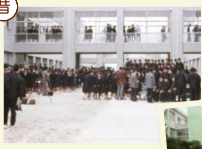
昭和40(1965)年 3期生入学クラス写真撮影