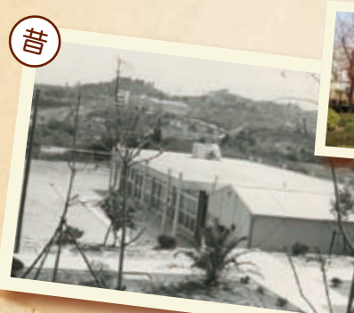
昭和42(1967)年4月 食堂を臨む