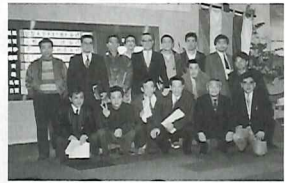
OB会総会出席者 於：ユアーズコーブ

性を感じ、新居浜のサッカー経験者が中心となり指導や大会を催し、地域が強くなるようにと頑張ったのが昭和四十年代でした。中学、高校とレベルの高い選手が育ち新居浜も全国を狙えるようになってきました。西高サッカー部支援の声が挙がってきたこの頃でした。当時の呼びかけの文章を記載してみます。