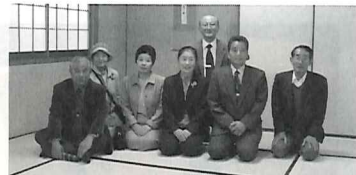
記念会館 3階 和室にて

今回のテーマは「いま、青春のころを語ろう」でしたが、男女に多少の差は有るものの、それぞれが多方面に多様に関わっている様子が賑々しく語っているのが印象的