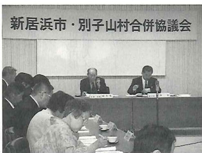
新居浜市・別子山村合併協議会

たことが伝えられ、それを受け、新居浜市においては、平成13年12月に市長や市議会議員が別子山村を訪問し、合併へ向けての作業に入ることが報告され、平成14年4月に新居浜市・別子山村合併協議会が設立されました。 合併は、別子山村を新居浜市に編入する方法で行われ、平成15年4月1日に施行を目指し、取り組まれています。