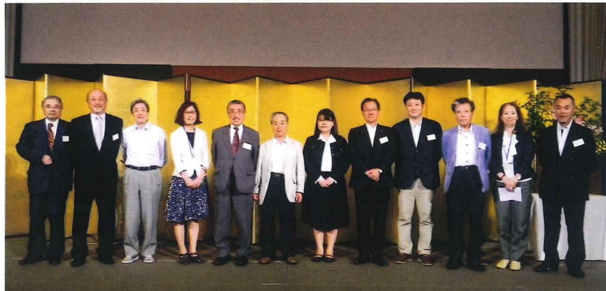
各支部等代表の挨拶