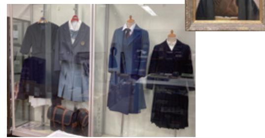
③女子高時代の制服