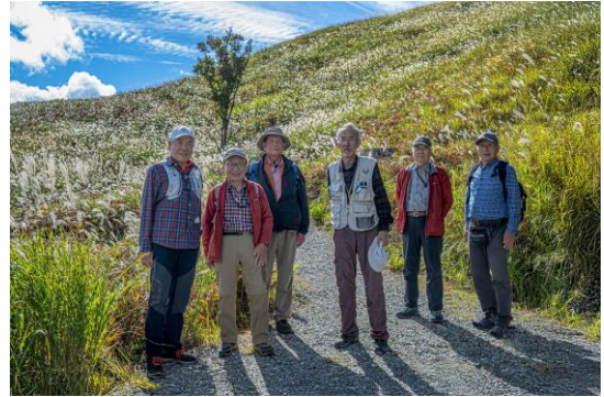
ハイキング道（仁木さんも合流）↑ ↓ 映画ロケの紹介