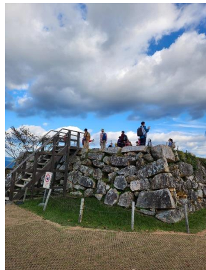
↑ 天守台に登るメンバー