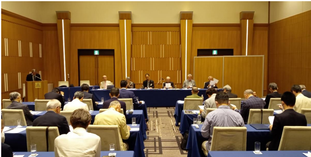
理事会・評議員会の会場