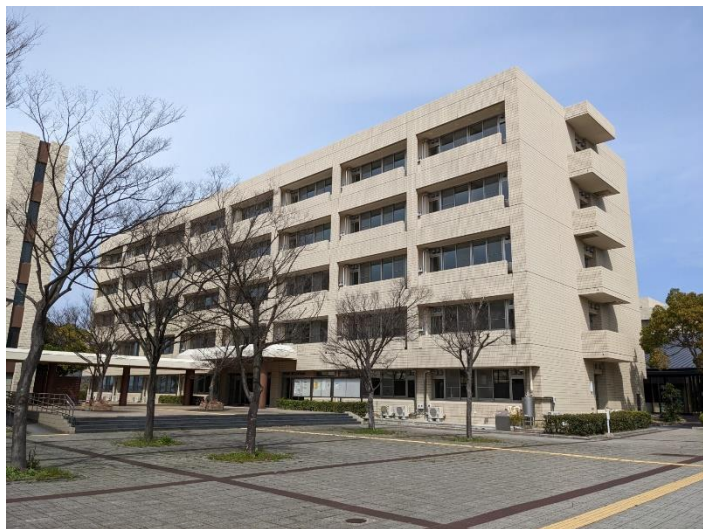
22年春に大規模改修工事を終えた経済学部棟 (現在の名称は、西3号館)

母校のブランド力を高め、母校愛を育むことの大切さと、それに貢献していく責任を改めて噛みしめた一日となりました。