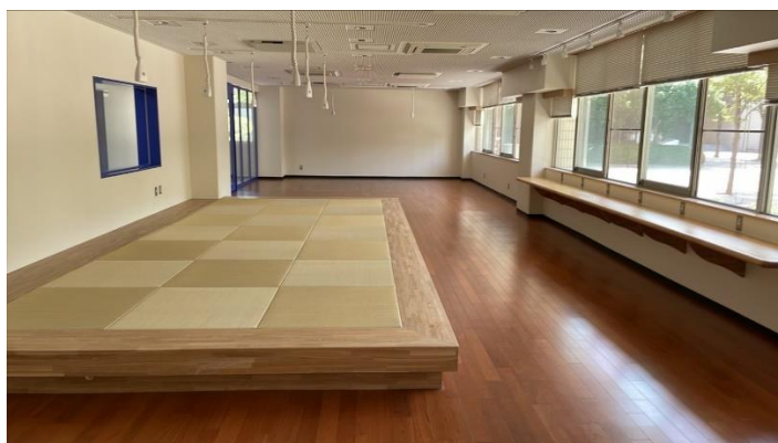
経済学部棟1階の「キャンパススクエア」 琉球畳が敷かれ、学生たちが共同作業や歓談をする スペースとして大いに活用されている