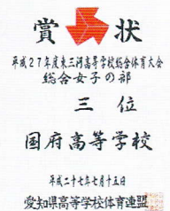
女子総合3位の賞状