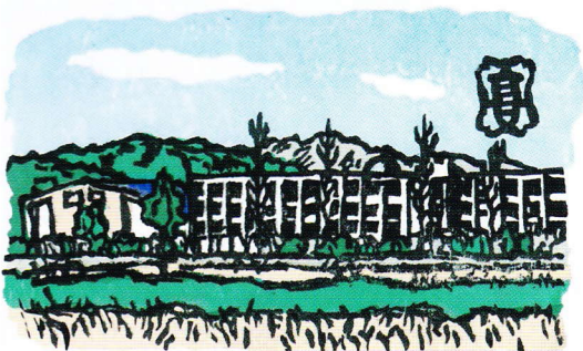
17回生記念誌の表紙のイラスト

そんな気持ちもあって、今回、卒業五十年の記念として、同期生の皆さんからのコメントそして同窓会・同期会等の写真及び住所録を編集して一冊の記念誌に纏めてみました。この度、ご寄附頂いた方又は同期会にご出席頂いた方にお送りいたしました。