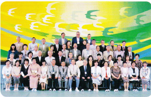
同窓会第17回生記念写真

乾杯に続いて、各クラスの記念撮影、懇親会へと移って行き、懐かしそうに、楽しそうに、正に十八歳にタイムスリップした表情が何とも言えません。カメラの記録が物語っています。