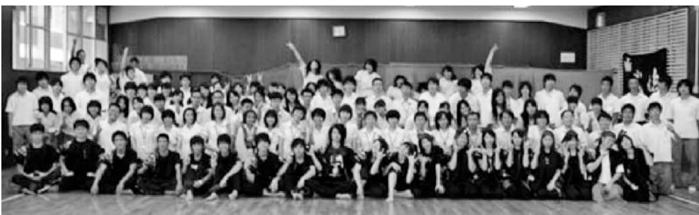
中国高校生と交流 明峰生有志によるソーラン節披露後の集合写真 2011.9.13-14

最後になりましたが、明峰高校がますます発展し、地域に愛される学校になりますよう日々努力を重ねてまいりますので、皆様の協力とご支援をよろしくお願いいたします。