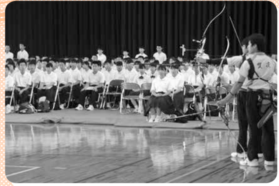
アーチェリー部紹介

アンケートの結果はたいへん好評で、賀茂高校に対する関心と入学意欲の高さを感じられました。