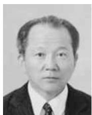
賀茂高校を卒業して48年以上が経ちます。今でも「真澄の空に」と校歌の歌詞が頭に浮かびます。自由な校風の中で勉強や部活ができました。その中で多くの友達を得ることができました。

高校生活で一番心に残っているのは、個性豊かな先生方から専門分野や人生観を聞くことができたこと