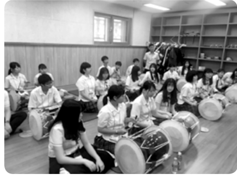
【8月 韓国で太鼓を練習】