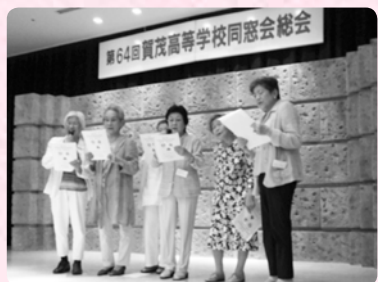
【賀茂高等学校校歌斉唱】

来年は、8月5日（日）に開催する予定です。当番幹事は、昭和44、54、平成元年、9、19年の卒業生です。お誘い合わせの上、多数ご参加くださいますようお願いいたします。