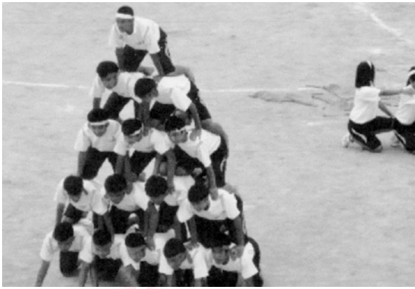
平成29年9月21日 体育祭が開催されました。