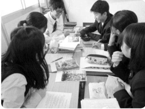
【10月 賀茂1年生英語の授業に参加】

8月には賀茂高校生21人が韓国の高校を訪問、10月には韓国から47人が東広島を訪れ、交流を深めました。