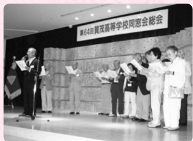
【西条高校校歌斉唱：昭和29年卒】