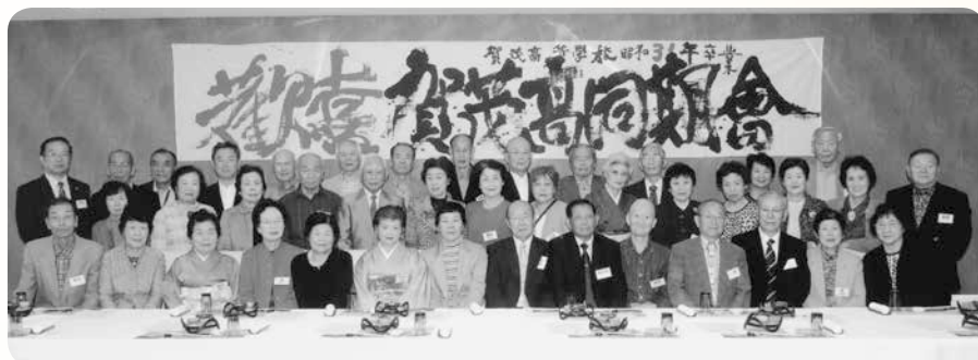
昭和31年卒同期会 (平成28年10月21日、 西条・白竜湖にて開催)

美味しい料理を味わいビールやワインを飲みながら和やかに歓談の輪が広がっていき、あっという間に楽しい時が過ぎました。