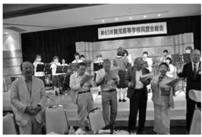
吹奏楽の伴奏で校歌を合唱

162名が参加し、盛大に開催しました。今年は昭和42年、52年、62年、平成7年、17年卒業の皆さんに幹事をお願いしました。昭和40年卒の同期会もあわせ開催、68人が参加しました。今後とも、多くの皆さんのご出席をお待ちしています。