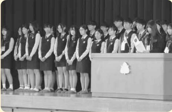
10月20日(木)ミチュホル外国語高等学校の皆さん47名が来校。 フォークダンスで歓迎した後、1年生の各クラスで、韓国仁川市と東広島市について互いに調べたことを発表しました。