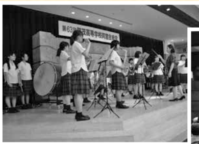
吹奏楽部の演奏が花を添えた