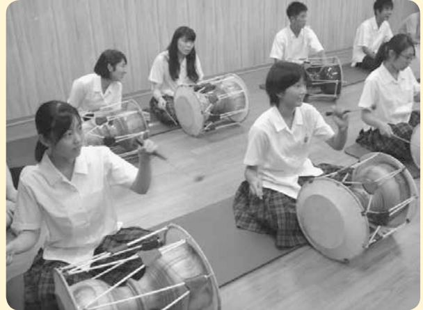
8月20日(土)～23日(火)、賀茂高生17名が、ミチュホル外国語高等学校を訪問しました。チャンゴの演奏を教えてもらった時の様子です。