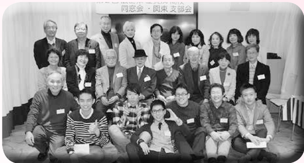
○第2回賀茂高校同窓会関東支部会 期日 平成26年2月11日 場所 イタリアンパニールPaccio (広島ブランドショップTAU3F) 参加 26名