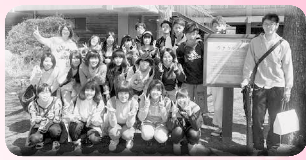
○平成26年卒3年1組お別れハイキング 期日 平成26年3月17日 場所 野呂高原ロッジおよび周辺 参加 23人