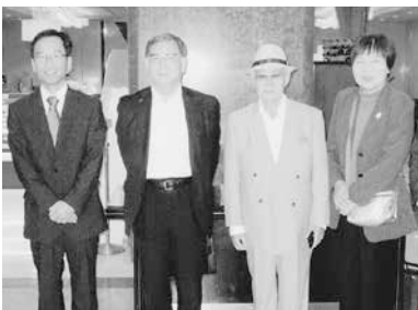
右から二番目が筆者