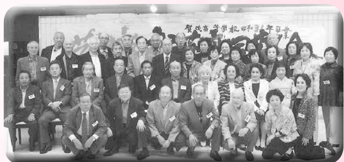
○同期会(昭31年卒業) 期日 平成26年10月15日 場所 メルパルクひろしま 参加 40名