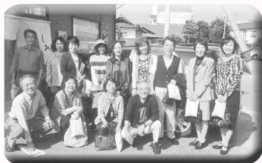
○3年2組の会(昭41卒) 期日 平成26年9月28日 場所 葉 参加 17名