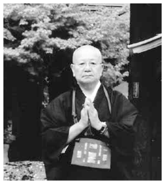
ホームページwww.ecocap.or.jpをご覧ください。

又、平成21年9月にNPO法人「エコキャップ推進協会」の事を知り、皆様に御協力をお願いし現在も続けています。ペットボトルの蓋860個で一人の子供の命が救えるとのこと。アフリカではポリオワクチンを接種出来なく毎日60人以上の子供が死亡している。平成26年9月現在、累計個数が354万1千208個、ワクチンが4千249人分出来ました。エコキャップに興味のある方は、