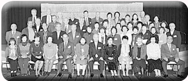
○賀茂高(昭35卒)同窓会 期日 平成26年3月27日 場所 グランラッセ東広島 参加 60名