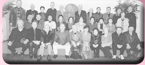
○昭和33年卒同期会(33会) 期日 平成26年1月30日 場所 白竜湖 参加 33名