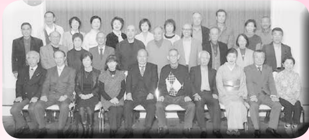
○昭和39・40・41年卒賀茂高寮同窓会 期日 平成25年11月24日 場所 グランラッセ東広島 参加 31名