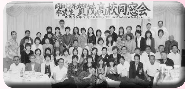
○同窓会(昭52卒全クラス) 期日 平成26年9月14日 場所 伯和ホテル 参加 62名