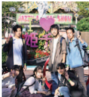
代替行事 3年次バス旅行