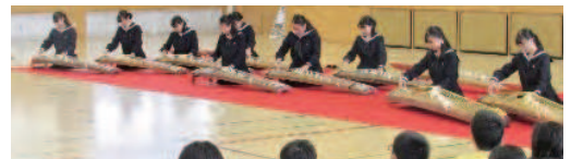
邦楽部 城東小学校との交流会