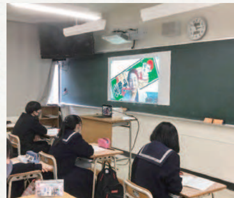
リモートによる上野千鶴子氏講演会 (東京大学名誉教授)