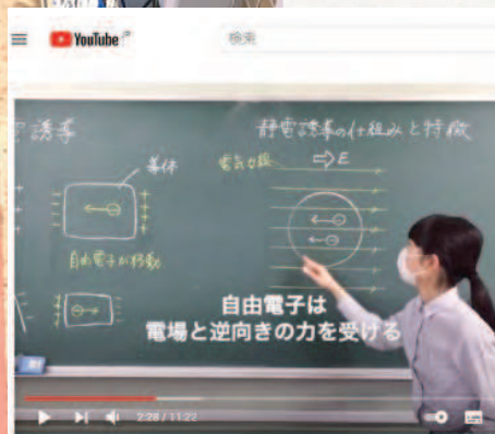
臨時休校中 3年次授業をYouTube投稿