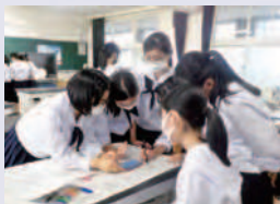
1年次探究活動の様子