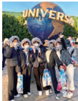
代替行事(修学旅行) 2年次バス旅行