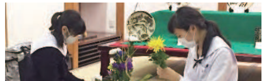
華道部 花き業界とコラボ企画「#ビタミンF」