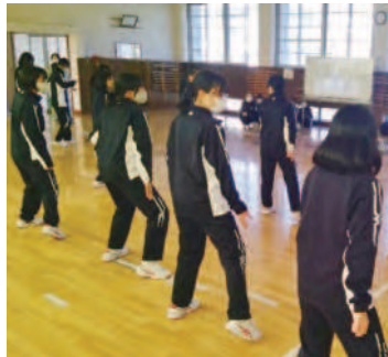
タブレットを利用した 体育の授業(ダンス)