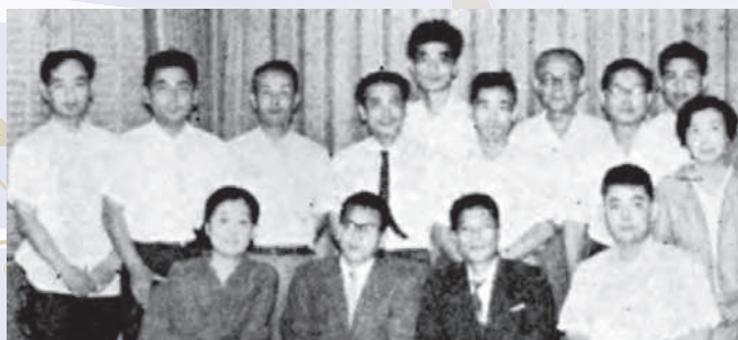
60周年(昭和44年) 記念誌編集委員会 2列目左から2人目