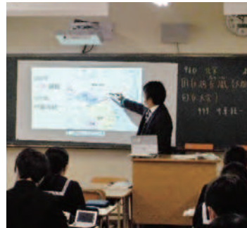
短焦点プロジェクターで 投影(世界史)