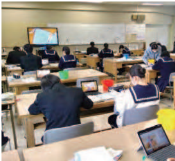
タブレットを利用した 被服実習(家庭)

消毒や手洗い、ソーシャルディスタンスなど WITH コロナの学校生活。文化祭や体育大会、修学旅行などの学校行事の中止により代替行事を行ったり、地域交流なども新しい形で挑戦しました。また、短焦点プロジェクターやタブレットの導入など ICT 化が急ピッチで進み、リモートによる全校集会や講演会の実施、授業の形態も激変しました。