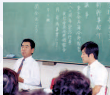
80周年(平成元年)に向けて幹事会