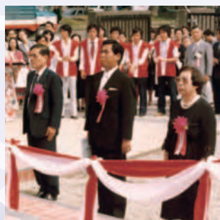
70周年 東生会館竣工(昭和54年)