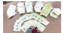
生活創造部 子どもマスクとどけ隊