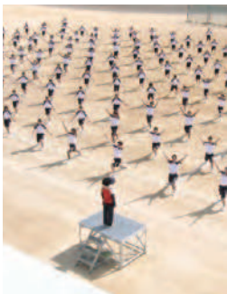
代替行事(体育大会) 1年次アジア体操披露