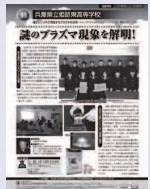
日経サイエンス誌の3月号で科学部の活動が紹介されました