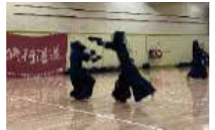
剣道 部員数：男 12 人女 8 人計 20 人 剣道を通して「頑張り方」を学ん でほしい。見学、体験大歓迎です