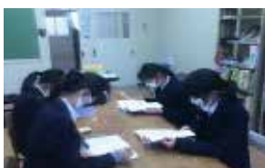
文芸 部員数：男 4 人女 5 人計 9 人 部員の作品を「滯標」という雑誌に まとめ、定期的に発行しています