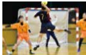
ハンドボール 部員数：男 30 人女 12 人計 42 人 県ベスト 8 を目標に真剣に全力、 笑顔で取り組んでいます