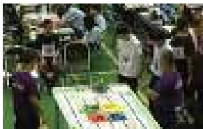
理科 部員数：男 6 人 週 4 日、農業からロボットまで 幅広く活動しています