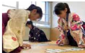
競技かるた 部員数：男 1 人女 21 人計 22 人 昇級を目指し週 4 回活動。昨年は 1 人が 神奈川県代表で関東大会に出場しました