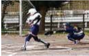
ソフトボール 部員数：女 3 人 ボールを投げる、とる、打つ。 シンプルで奥が深い競技です