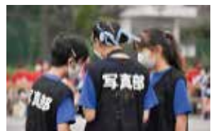
写真 部員数：男 5 人女 18 人計 23 人 学校行事の撮影や、ときどき 撮影会を行っています