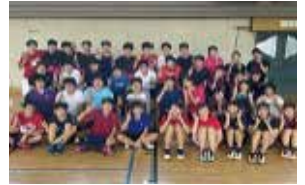
バドミントン 部員数：男 46 人女 26 人計 72 人 日々仲間と切磋琢磨し、県大会 上位を狙っています