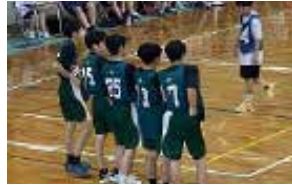
バスケットボール 部員数：男 16 人女 15 人計 31 人 バスケットボールを通じて人生に 彩を与えていきます！