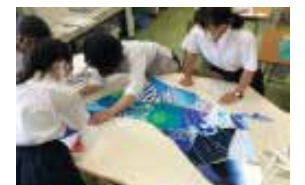
美術 部員数：女 10 人 週 2 回、楽しくほのぼのと充実 した部活動をしています