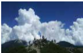
山岳 部員数：男 19 人女 3 人計 22 人 夏に 3000 m 級の山に登るのを 目標に日々トレーニングです