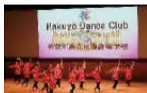
ダンス 部員数：女 40 人 部活動 3 年目。今年は 1 年生が 25 人も 入部。週 3 回楽しく真剣に活動です