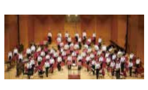
吹奏楽 部員数：男 8 人女 55 人計 63 人 音楽が好きで部員が団結して 一つの音楽を作り上げています