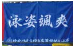
水泳 部員数：男 16 人女 10 人計 26 人 「部員全員で県大会出場」を目標に 日々努力しています