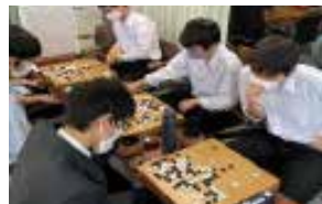
囲碁将棋 部員数：男 14 人女 1 人計 15 人 2022 年個人戦全国大会出場団体戦 神奈川県予選準優勝です