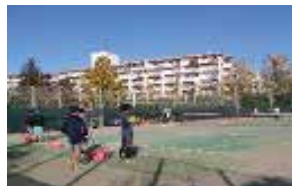
ソフトテニス 部員数：男 25 人女 9 人計 34 人 女子団体県ベスト 8、男子個人県 4 ペア出場。絶賛活躍中！