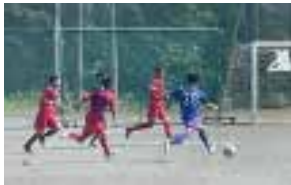
サッカー 部員数：男 47 人女 4 人計 51 人 選手権県予選で 2 次予選へ進出 できる活動をしています