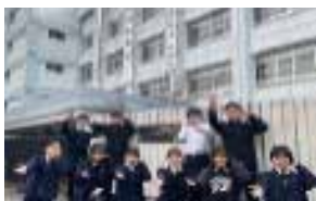
英語 部員数：男 19 人女 27 人計 46 人 世界大会出場を目指して頑張っ ています