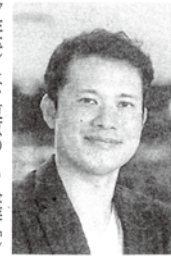
父の転勤で幼少期をドイツで送った結城。父の教え「失意泰然、得意淡然」が座右の銘だ