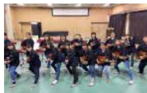
クラシックギター 部員数：男 2 人女 19 人計 21 人 週 3 回、楽しくまったり活動し ています