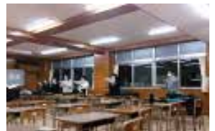
合唱 部員数：男 3 人女 14 人計 17 人 活動に制限がある中も、前向きに 練習・発表に取り組んでいます