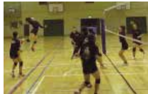
バレーボール 部員数：男 16 人女 24 人計 40 人 皆で元気に充実した活動を実施 しています