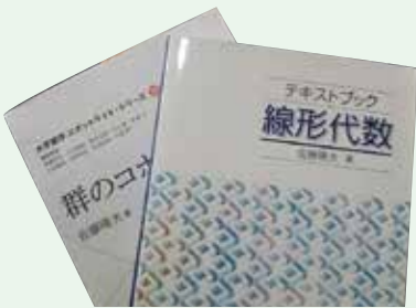
佐藤さん著書 「線形代数」大学 1年生用の教科書 として使用されて いる