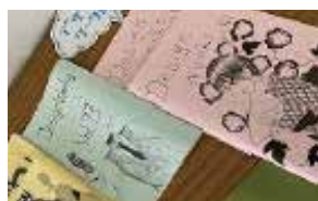
デザインワーク 部員数：女 13 人 週 1 回、楽しく活動中！年に 6 回 程度部誌を発行しています