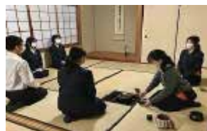
茶道 部員数：男 2 人女 15 人計 17 人 週 1 回表千家の先生にご指導いた だいています。皆熱心にお稽古です