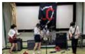
軽音楽 部員数：男 37 人女 51 人計 88 人 週 4 日楽しく充実した部活動を 実施しています