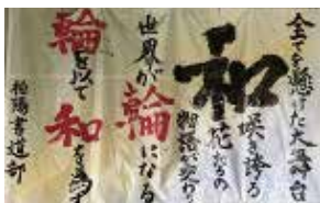
書道 部員数：男 1 人女 7 人計 8 人 週 2 回、楽しく真剣に活動し ています