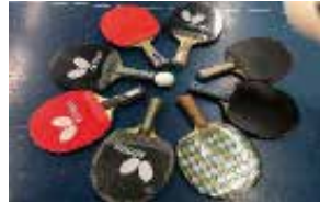
卓球 部員数：男 15 人女 6 人計 21 人 個人、団体ともに県大会に出場 しています