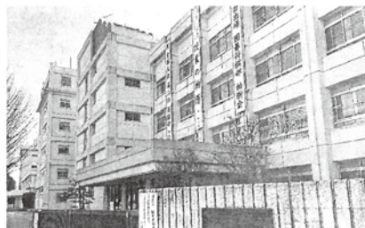
県立柏陽高校の正門 ＝横浜市南区柏陽

柏尾川が近くを流れ、丘陵を背に陽光を浴びる。県立柏陽高校はその立地から名付けられた。開校は1967(昭和42)年。創立55年を迎え1万8千人以上の生徒を送り出し、卒業生たちは音楽や放送と様々な世界で活躍する。初回はスポーツ界を牽引してきた卒業生たちの青春を振り返る。