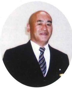
昭和45年 機械科自動車卒業

庄原市内と高野・庄原両郵便局間、約40キロメートルを車で毎日3往復を30年間。年中無休、安全、確実、無事故で郵便物の委託運送を続けられました。