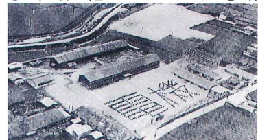
昭和26年学園設立認可