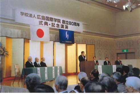
創立80周年記念式典

10月31日の記念式典は、県知事をはじめ教育界、政経財界の多くの来賓を迎え、華々しく開催されました。学校関係者ならびに同窓生は、80周年の歴史の重さと、受け継がれてきた伝統、学校の素晴らしさを改めて思い知り、大きな感動を受けました。