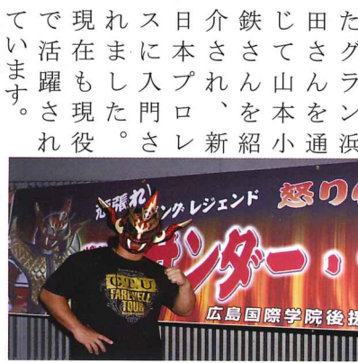
怒りの獣神 サンダーライガー 広島国際学院後援会一同

高校卒業後、新日本プロレスの入門テストを受験。体力テスト等は合格基準を満たしましたが、身長が低かったために不合格。その後、単身でメキシコに渡り、そこで出会ったグラン浜田さんを通じて山本小鉄さんを紹介され、新日本プロレスに入門されました。