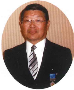
昭和37年 機械科卒業

国民体育大会の広島県選手団本部役員として社会体育に貢献されました。現在、広島県山岳連盟を代表して広島県体育協会常務理事として活躍。