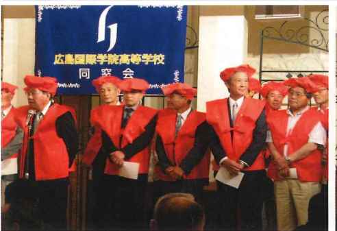
昭和41年卒の還暦軍団