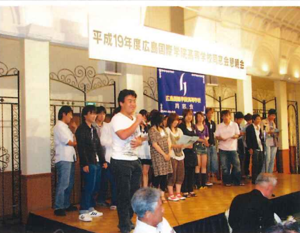
平成19年卒の若者軍団