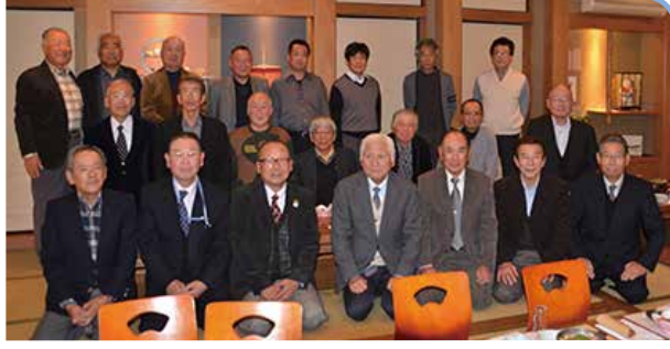
H29.11.18(土) 熊野支部総会・懇親会