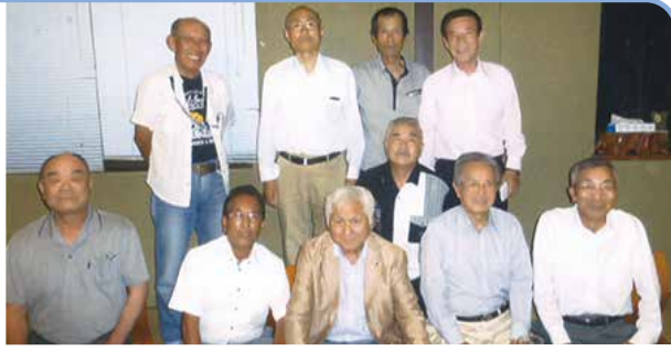
H29.7.22(土) 安浦支部総会・懇親会