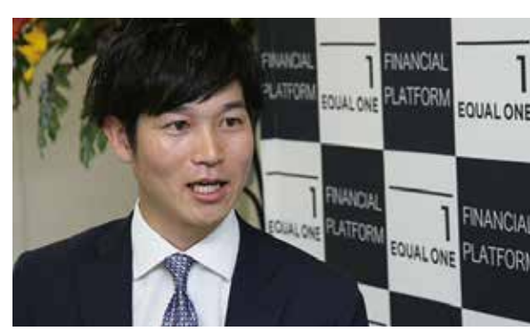
ユニフォームを脱ぎ新たにスーツになった姿

現在ユニフォームを脱いで新たに保険会社のイコールワンで営業として頑張っています。どうして保険という職種を選んだかという、病気をし、克服した僕だから伝えられることがあるのではないかと思います。何か突発的な事が起こるのは誰も予測できない。そういったときに必要なのが保険です。これからは、人生とお金に向き合う大切さを、出会うお客様すべてにしっかりと伝えていきたいです。