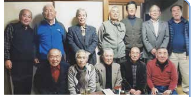
H29.12.17(日) 安佐支部定例会