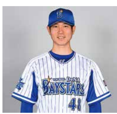
現役の時のユニフォーム姿

現在ユニフォームを脱いで新たに保険会社のイコールワンで営業として頑張っています。どうして保険という職種を選んだかという、病気をし、克服した僕だから伝えられることがあるのではないかと思います。何か突発的な事が起こるのは誰も予測できない。そういったときに必要なのが保険です。これからは、人生とお金に向き合う大切さを、出会うお客様すべてにしっかりと伝えていきたいです。