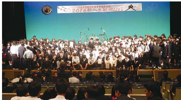
新入生達と記念撮影

クラブ目標は、軽音楽連盟主催の大会で入賞をすることです。一方で、初心者生徒たちが楽しくバンド活動ができるレベルに育ってくれることです。限られた部室、器材数ですが本校軽音楽部は元気に活動しています。