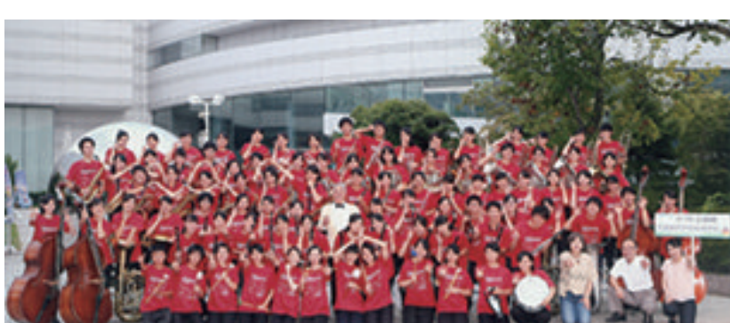
全国総合文化祭で演奏する吹奏楽部

8月2・3日に広島で開催された全国総合文化祭の吹奏楽部門に出場しました。「楽劇『サロメ』より7つのヴェールの踊り」とタップダンスと共に「ガインシュインメドレー」を演奏して文化連盟賞を受賞し、他校との交流もあり、充実した大会になりました。