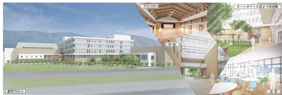
平成30年完成予定新校舎イメージ

現在、校舎、体育館、ホールを新築中で、人口芝のグラウンドも整備予定です。新校舎は交流スペースやラウンジ、充実した図書スペースを備え、生徒同士のふれあいや居場所作りを意識した設計です。また新校舎は地域貢献の一環で、災害時に避難所としても機能するようにしています。新校舎と体育館は2018年4月、ホールは同9月の使用開始を予定しています。