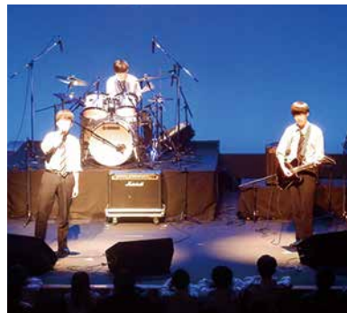
新入生歓迎LIVEの様子

本校軽音楽部は、10以上のバンドメンバーが集合しているクラブです。2010年度から広島県高等学校軽音楽連盟に所属し、大会にも参加しています。過去には入賞、さらにはNHKが放映した「スクールライブショー」に出演する生徒もおりました。