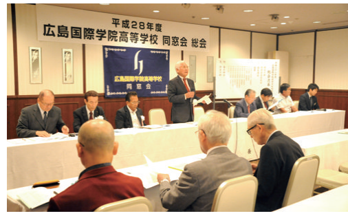
平成28年度の定期総会

平成28年度同窓会・総会は、広島ガーデンパレスにおいて6月22日(土)盛大に開催されました。