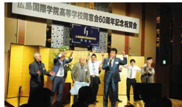
歌手加納ひろしさんと一緒に