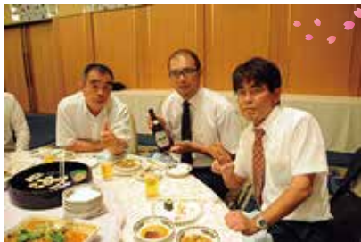
先生も楽しく談笑