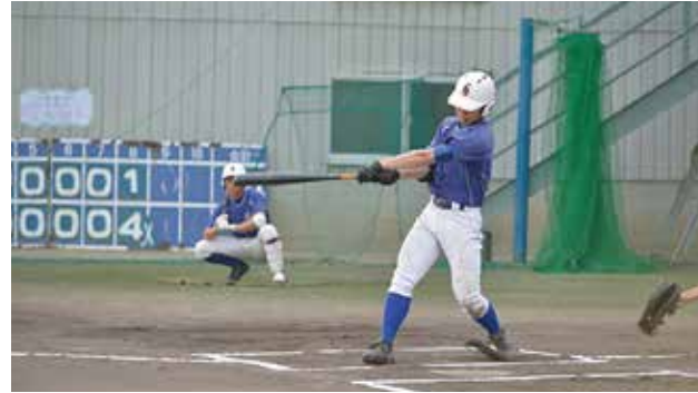
全国出場を目指しひたむきに日々練習

秋季大会は10月24日に一回戦島根県代表出雲高校と対戦しましたが、4対5で敗戦いたしました。試合を通して一球、一瞬の大切さを痛感した試合でした。これからの来季に向け日々精進し、自分たちの野球「こころ」を強くし前進してまいりますので、引き続きご声援をお願いいたします。