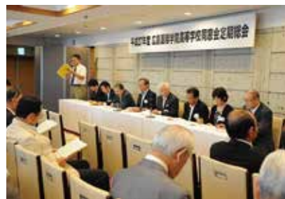
平成27年度の定期総会

また、秋には硬式野球部が、「秋季高校野球広島県大会」に出場し、見事初優勝の快挙を成し遂げてくれました。中国大会では残念ながら涙を呑み、甲子園初出場は果たせませんでした。甲子園出場が近づいたように思います。昨年度全国大会に出場した陸上競技部。今年度は惜しくも連続出場を果たせませんでした。次年度に繋がる走り、全国大会出場に向けて頑張つていきます。