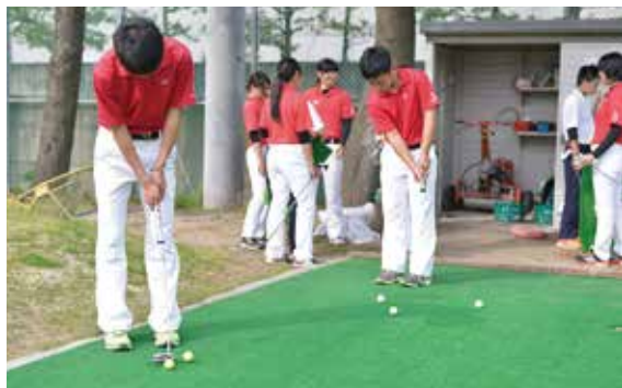
正確なショットが必要とされるパット練習

平成27年8月4日、5日に宇部72カントリークラブ万年池東コースにて行われた「第36回全国高等学校ゴルフ選手権大会団体男子の部」において、本校ゴルフ部が見事全国制覇を成し遂げました。同大会女子の部宇部72カントリークラブ万年池西コースでは8位入賞と男女とも好成績を上げました。創部27年で全国の頂点に立つことが出来たのは、選手達の団結力と努力の成果だと思えます。ゴルフ部員には、常日頃から