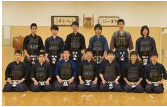
部訓を大切にす剣道部

我々剣道部は、部訓である『尊聞行知』のもと、『全国大会出場』を目標に掲げ、現在男女合わせて15名で稽古しています。日々、自分を磨き、道場で汗を流しています。本年度は、男子団体戦で県大会ベスト8、女子個人戦で県大会ベスト16に入るなど、男女で団体個人ともに上位に進出しました。