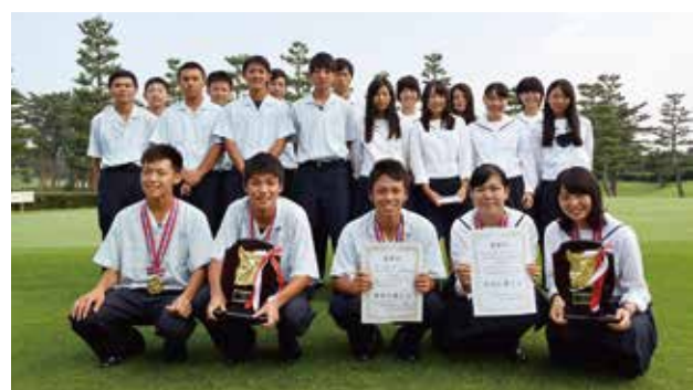
全国で活躍しているゴルフ部

彼が言うには「常に上手くなるためにはどうしたらいいかを考えるようにしており、ランニングで自分をぎりぎりまで追い込み、集中力を高めている」とのこと。今後も常に挑戦者の姿勢で挑むゴルフ部の活躍に期待していただきたいと思えます。