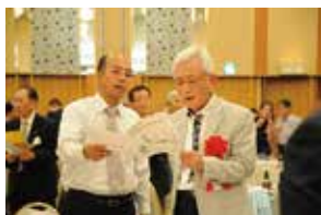
学園・同窓会の飛躍を祈念して校歌斉唱