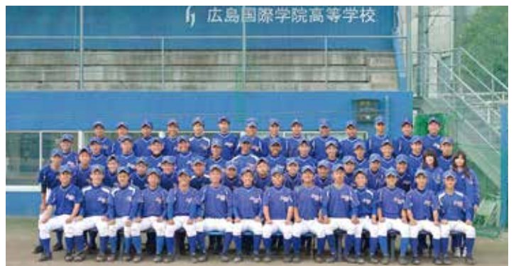
初優勝を果たした硬式野球部