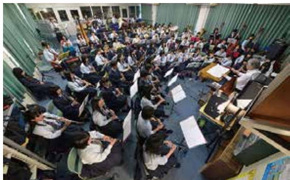
次の演奏会に向けて練習する吹奏楽部

で「挑戦」をスローガンに、来年度のインターハイ出場を目指し、日々の練習に励んでいます。練習環境は決して恵まれているとは言えませんが、どうすれば強くなれるか自分たちで主体的に考え、工夫しながら練習を行っています。