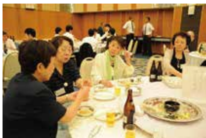
顔馴染みの仲間と談笑