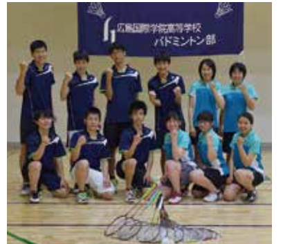
伝統あるバドミントン部

本校バドミントン部は創部40年を数え、団体、個人ともに全国大会に何度も出場している伝統あるクラブです。多くのOB、OGの方々に多大なるご支援や応援をいただき、昨年度の県新人戦の男子団体戦で3位、今年度の県総体の男子団体戦で3位という結果を残すことができました。現在は2年生7名、1年生15名