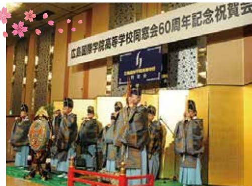
坂雅正会による雅楽演奏