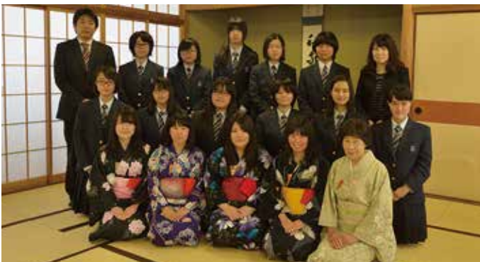
校内外で活動する華・茶道部

日々の稽古や校外活動を通して、心と立ち居振る舞いの美しい人に成長したいと思っています。茶道部は、8月6日に催行された平和祈念茶会のお手伝いを行い、原爆70年の節目に平和の思いを馳せながら、参列者の方へお茶を差し上げました。校内では学べない会に参加したり、他校の生徒の皆さんや諸外国の方と国際交流などをしたりしながら、総合芸術と言われるお茶の世界を楽しんでいます。