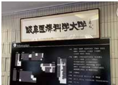
茂住 菁郎氏による題字