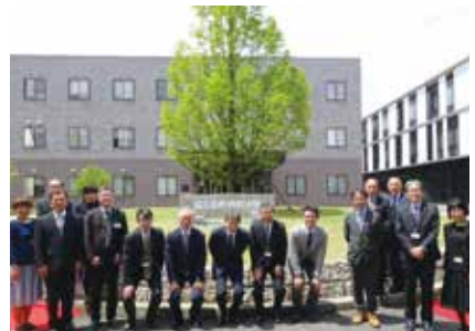
寄贈した石碑前にて記念撮影