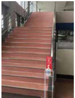
▲学内の各建物の入り口に消毒液を設置し、手指消毒をしてから立ち入ることにしました。