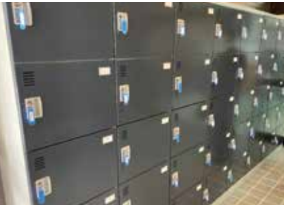
152名分の学生ロッカー(鍵付き)