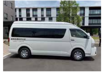
寄贈した10人乗りワゴン車