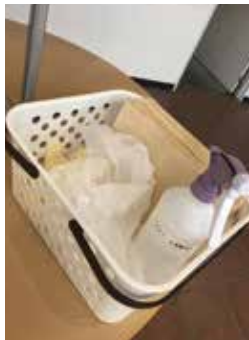
▲毎日14時頃に学内の消毒を実施するため、当番制で先生方が学内を回っています。