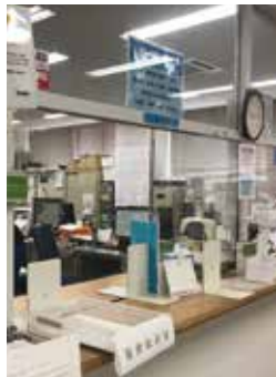
▲来学者の受付窓口や学生対応のための窓口には、飛沫感染予防のためのアクリル板を設置しています。