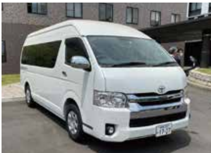
寄贈した10人乗りワゴン車

ワゴン車の活用方法は、未定ですが、学生の移動等にも活用していくそうです。また、図書館学生ロッカー（鍵付き）は物置として便利であり、図書館を利用しやすくなります。次に、除幕式の様子や寄付の写真一部を掲載します。