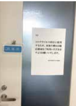
▲新型コロナウイルス感染症の疑いのある学生が学内で発生したときのために、他の学生と隔離して対応できるよう、部屋を準備しました。