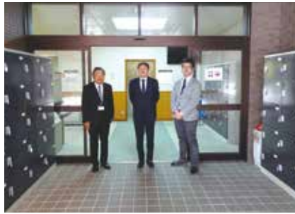
寄贈した図書館学生ロッカー前にて