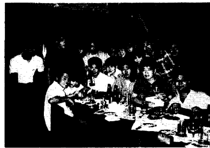
短R5 名古屋市栄にて

〈勤務先欄〉に長谷川接骨院と記入しましたが、放射線技師としてではなく、柔道整復師としてのですので、同窓会名簿の勤務欄がもし放射線技師の資格としてのものでしたら削除していただいで結構です。技師として六年病院で勤務し、その後父と共に今の仕事に就いて六年目になろうとしています。今では放射線関係の最新情報に疎くなり、やや淋しい思いがしています。(柔道整復師の魅力は何ですか).....編集者