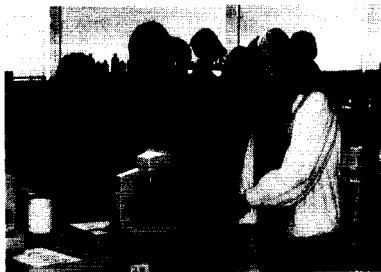
学校見学会風景より

話を元に本学に魅力、関心を持ち詳細な情報を求めに来る方が数多くあります。この事より卒業生諸君の活躍が本学進学への大事な要因になっているのを強く感じます。全国の医療技術の勉学に意欲をもつ学生を集め、十分な教育を行い、諸君らの地元就職し、同窓生として共に医療技術を通して、社会に貢献する流れを大いに作りたいたいと思っています。