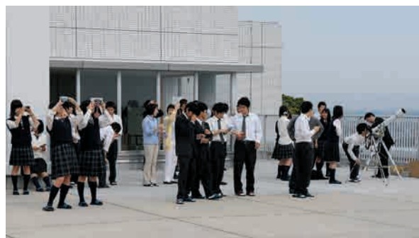
5月21日の朝、金環食の見学会が屋上で開催された

現在日本は、国の財政危機、少子高齢化、デフレ、円高、東日本大震災被災地の復興、原発問題等々、多くの課題が山積しています。生徒たちが社会に出たとき、世の中が良くなっているとは限りません。むしろ、悪くなっているかもしれません。日本の将来は、彼らが活躍してこそ、発展し、良くなっていくと私は信じています。彼らが、このグローバル化社会の中で、日本の将来の力を握っています。彼らの社会での活躍を期待しています。