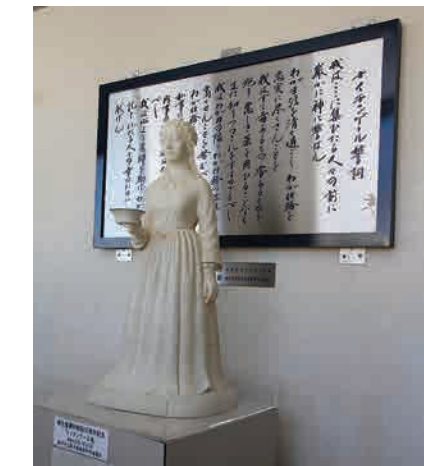
看護科生を見守ってきたナイチンゲール像とナイチンゲール誓詞

査結果によると被害住宅は3、896棟で、中でも飯岡地区の185棟は津波による全壊で、そのほとんどは当時解体され、海岸沿いには空き地が点在していますが、最近少しずつ復興の兆が見えてきているのは嬉しいことです。家屋が全壊した被災者の多くは元の土地への再建に大きな不安を抱いていると思いますが、私の妻もその一人でした。でも被災から半年を過ぎた頃、皆様からのお見舞いや激励のお陰で気持ちに落ち着きを取り戻し、再建への気持ちが固まったので前向きに復興へと取り組みました。私はお山(22年)十四高(5年)の長い教員生活の沢山の思い出と指導経験を活かして現在千葉科学大学と旭中央病院看護専門学校で非常勤講師をする傍ら、「いいおか津波語り継ぐ会」のメンバーの一員として時々開催される防災教室に参加しています。今のところ健康です。若い学生とのふれ合いが私の健康の源のようです。最後に、被災された方の早期の復興と新銚子市立高校の益々の発展を祈念いたします。