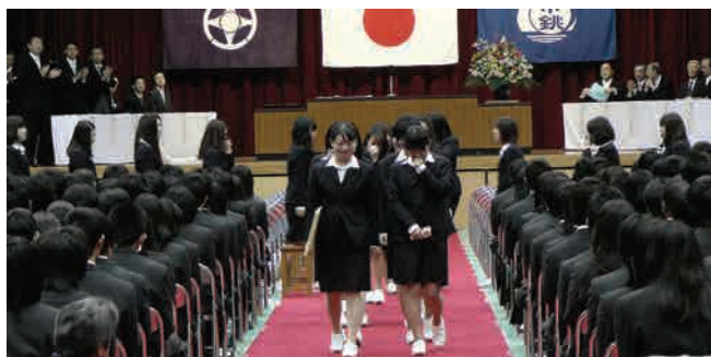
卒業式より。退場するのは最後の看護科専攻科生