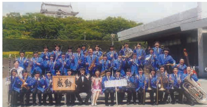
▲9月8日に開催された東関東吹奏楽コンクールで金賞を受賞された吹奏楽部のみなさん

実に実績を挙げております。また、旧西高校から続いた看護科が専攻科36名の卒業を以って35年の幕を閉じ、徐々にその体制も変わりつつあります。一方で、今母校を取り巻く教育事情は県の第二次高校再編の余波や少子化による市内学校小児童生徒の減少により、今後地域の市立高校としてのあり方が問われつつある様に思われ、将来的にはこれらの課題に対処する施策が必要になって来ると感じます。