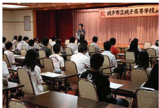
8月6～9日、湯沢で行われたサマーセミナー