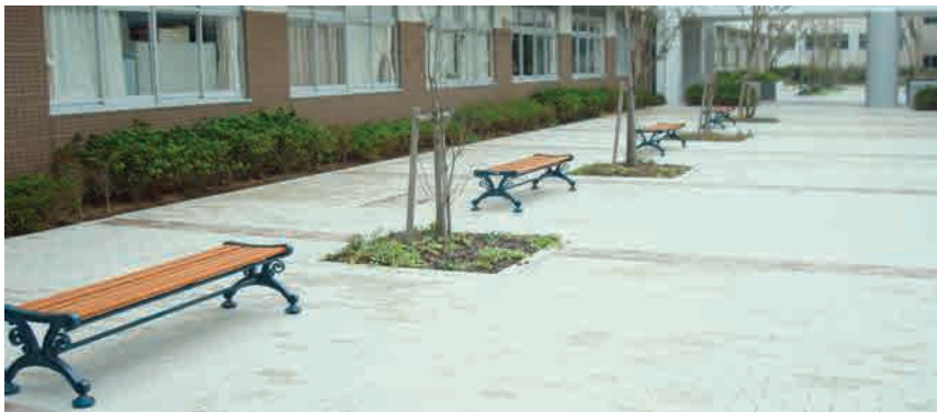
中庭に設置されたベンチ