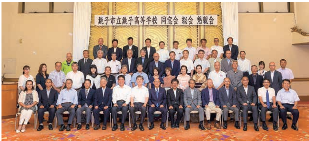
平成 29 年 7 月 23 日 (日) 同窓会総会 懇親会に参加された皆さん

たくなるような同窓会」をイメージして新しい企画を練っていきたく思います。大いに同級生同士、また、年齢を超えて先輩の方々、後輩の皆さんとも懇親の輪を深めていただければ幸いです。