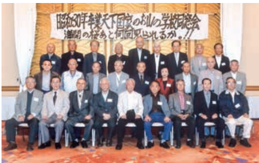
学年同窓会(昭和30年卒)