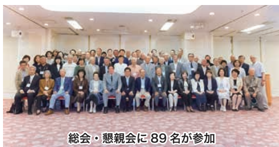
総会・懇親会に89名が参加