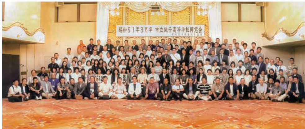
還暦同窓会(昭和51年卒)

昭和56年度 総合体育大会 3位 関東大会Aブロック出 場。初戦高崎(群馬) に悔敗。インターハイ 県予選2年ぶり2回目 優勝3年連続出場。川 崎インターハイ初戦 浪商(大阪) に敗れる。 長身選手によりゴール 下は対等に戦えたが、 ガードのゲームメイ ク、シュート力不足が 敗因となった。 昭和58年度 総合体 育大会ベスト4 関東大 会Bブロック出場。初 戦横浜緑が丘に敗れ る。インターハイ県予 選ベスト4にて出場 ならず。チームは小粒 ながらスピード、外郭 からのシュート力に 優れ、粘り強いチーム だった。 これらの黄金期にも 強豪校は県内外から優 秀選手をスカウトし強 化している中で、生徒