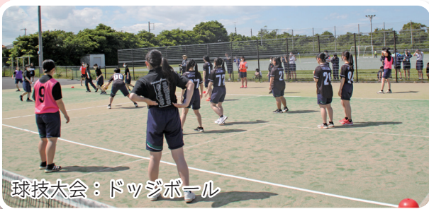
球技大会：ドッジボール