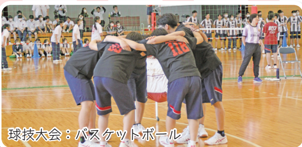
球技大会：バスケットボール