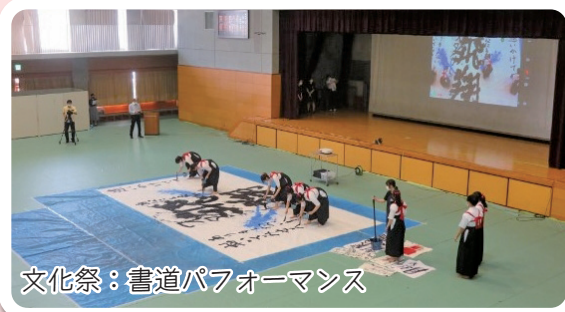
文化祭：書道パフォーマンス