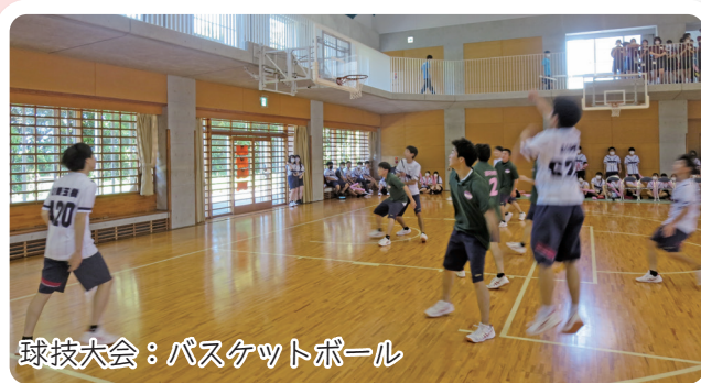
球技大会：バスケットボール