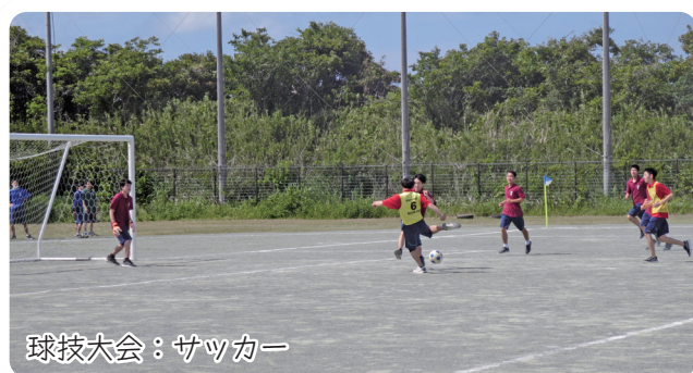
球技大会：サッカー