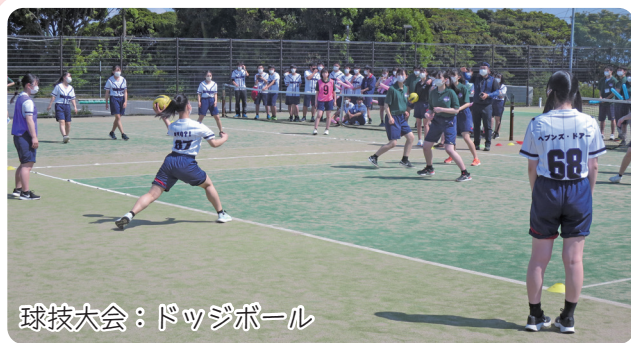
球技大会：ドッジボール

5月に球技大会、6月に市銚祭(文化祭)が開催されました。感染防止対策を施しながらではありますが、生徒たちは躍動感あふれるパフォーマンスや作品を見せてくれました。学校行事も順調に実施できており、10月にはスポーツ大会、2年次生は11月に修学旅行が控えています。