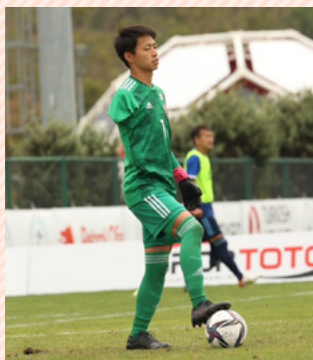
平成29年度卒業 (49期生)