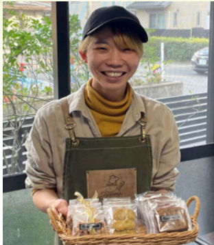
平成25年度卒業 (45期生)