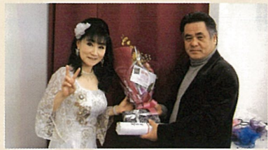
ひがしくにのみやふん かほうしょう 東久邇宮文化褒賞を受賞して