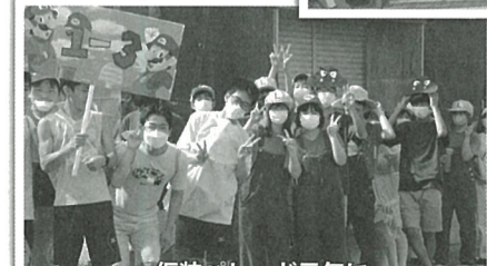
衣装パレード元気に