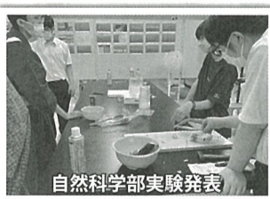
自然科学部実験発表