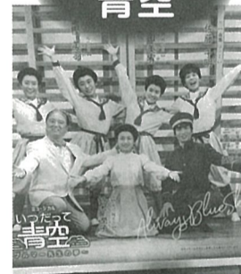
令和4年11月2日開催 二本松市民会館