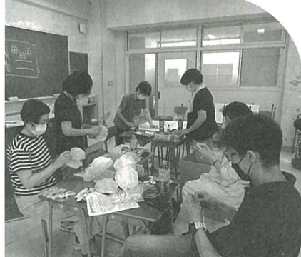
文化祭の準備に励む同窓会役員たち