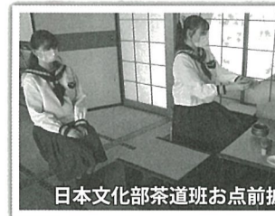
日本文化部茶道班お点前披露