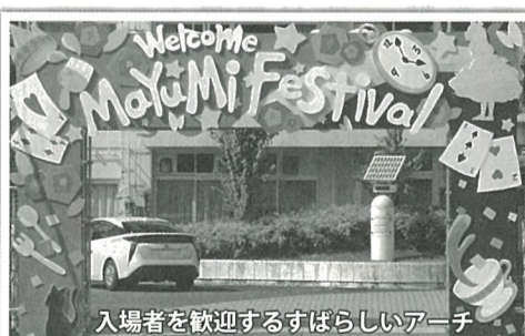
入場者を歓迎するすばらしいアーチ