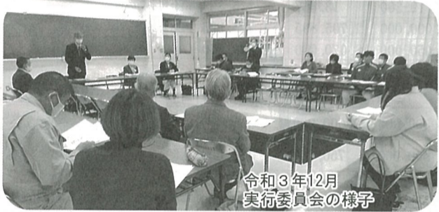
令和3年12月 実行委員会の様子

五輪会長、猪俣校長、松山PTA会長から挨拶のあと、各委員長より進捗状況報告と今後の活動計画等の発表がありました。