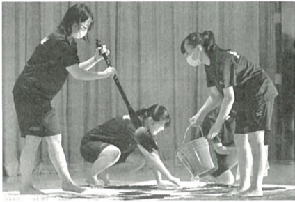
日本文化部書道班